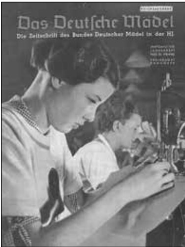
Jahrgang 1939, Januar.