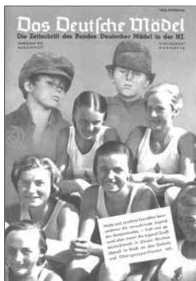
Jahrgang 1941, August. »Müde und zerstörte Gesichter kennzeichnen die verwahrloste Jugend des Sowjetstaates, – froh und gesund aber nimmt die Jugend Großdeutschlands in diesen Wochen überall im Reich an den Gebiets- und Obergausportfesten teil.«

Etwas anders sind die Szenen aus › Sport und Spiel ‹ (bis 1938 häufig) gestaltet: Sie transportieren neben Spaß ein Ideal von körperlicher Fitness 25 und illustrieren den in den Artikeln betriebenen Körperkult, die Leser*innen permanent aufzufordern, ihre Körper zu »stählen« und »funktionstüchtig« zu halten. Der Leistungsgedanke ist unübersehbar; die Fotografierten sind hochkonzentriert. Mitunter sind neben disziplinierten Übungen auch lachende Mädchen oder Spiele zu sehen; wenn sie jedoch die uniforme Sportkleidung tragen, ist klar, dass es keine Freizeit, sondern eine BDM-Aktivität inkl. einer Absicht der Führerin ist. Die Wertlegung auf körperliche Leistung wird als »gesund« und als NS-Erreungenschaft, das heißt auch als Eigenwerbung, dargestellt. Ein auffallen-