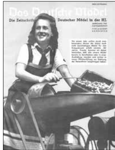
Jahrgang 1941, November.

»Vor einem Jahr sollten durch eine besondere Aktion die bisher noch nicht berufstätigen Mädel für den Kriegseinsatz erfaßt werden. Mit stolzer Freude konnten wir dabei feststellen, daß alle unsere Mädel bereits im Berufsleben oder in einer Ausbildung standen und seither in treuer Pflichterfüllung zur Stärkung der Heimatfront beigetragen haben.«