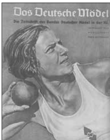
Jahrgang 1939, August