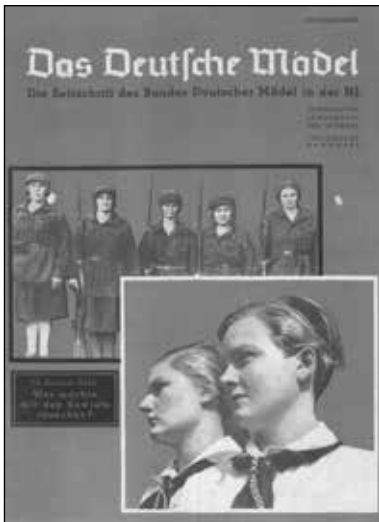
Jahrgang 1938, Januar. »In diesem Heft: Wer möchte mit den Sowjets tauschen?«