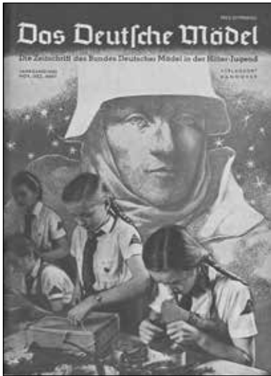
Jahrgang 1943, November/Dezember

tenen Motive von ›Soldaten und Militarismus‹ sollten den Leser*innen Soldaten als verehrens-wert zeigen 20 sowie die »Einheit von Heimat und Front« 21 suggerieren, das heißt eine Verbundenheit von Soldaten und unermüdlich arbeitenden »Mädeln« konstruieren. Sie werden in den Artikeln – zwecks Instrumentalisierung und Ausnutzung (Dienste, Beruf etc.) – ständig ermahnt, moralisch verpflichtet zu sein, mit Fleiß, Gehorsam und Aufopferung genauso Leistung zu erbringen wie die Soldaten, die selbstlos für sie im Krieg seien und für sie ihr Leben riskierten. Diesen »Helden« müssten sie sich in der »Heimat« würdig erweisen, so die permanente Drohung, darauf müssten diese sich verlassen können. Man habe die »deutschen Soldaten« stolz zu machen, wenn sie nach dem Krieg zurückkehren. Wehrmachtssoldaten werden also auch als urteilende Instanz inszeniert, denen die Daheimgebliebenen durch Pflichterfüllung und Unterordnung Rechenschaft schuldig seien.