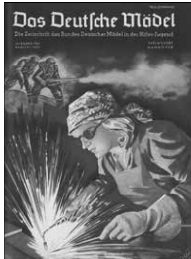
Jahrgang 1943, Mai/Juni.

tur« (zum Beispiel durch harte körperliche Arbeit oder dadurch, dass sie Soldatinnen/Beamtinnen und sogar in hohen Positionen werden konnten). Teils wurde behauptet, Frauen täten dies staatlicherseits gezwungen und litten darunter.