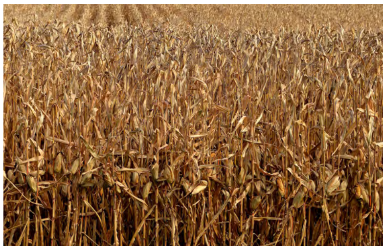
Silage cornfield